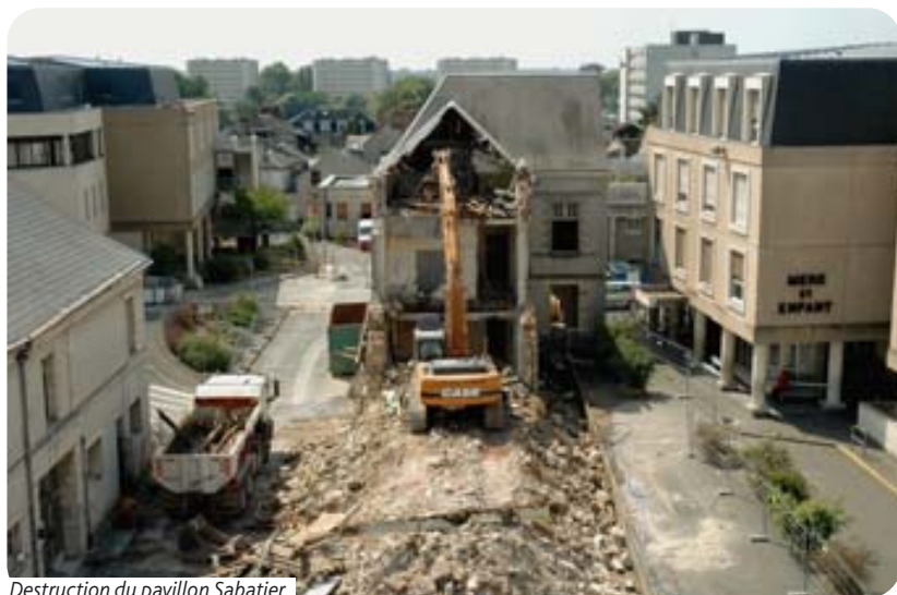
Destruction du pavillon Sabatier